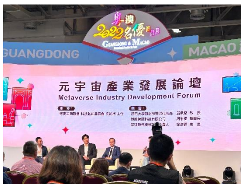
图为学校推荐参加的在澳门威尼斯人举办的粤澳 2022 名优商品展，期间听取了几个商业论坛，以及参观了各大商品展销会，初步认识了解到粤澳两地工商业的经济贸易合作生态。