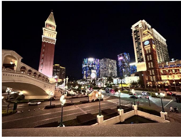
澳门金光大道夜景一隅。