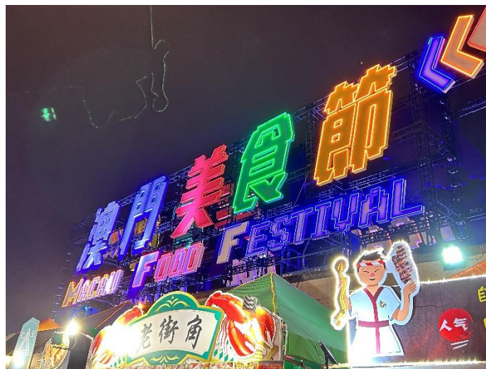
澳门美食节，作为旅游城市经常有许多活动。