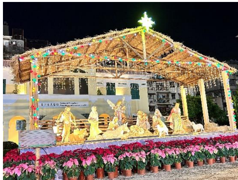
塔石广场圣诞市集装饰。