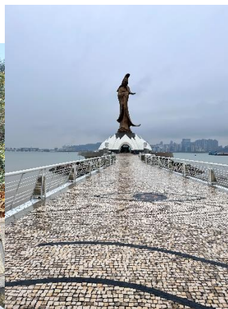
图为位于妈阁码头旁边的妈祖阁以及妈祖观音像。庙虽不大但却是本地人珍视的信仰。