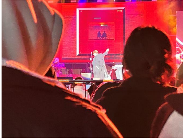
澳门不愧为旅游城市，图为免费音乐会，很值得一去。