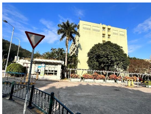
最后一次离开学校在门口拍的好天气留影。