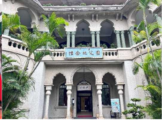
参观了国父纪念馆，了解了更多孙中山先生及其家人在澳门时旅居的生平事迹。