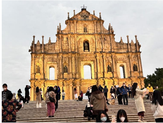
经典地标大三巴牌坊。