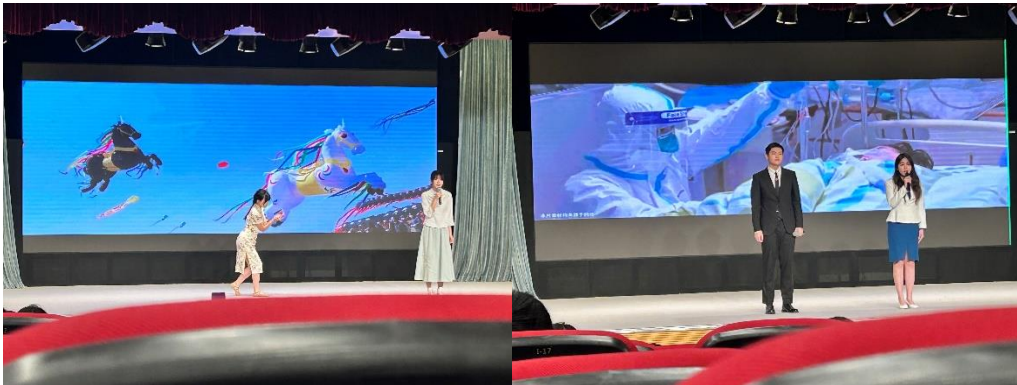
图为等待时间的穿插表演，令人印象十分深刻，出乎意料的高质量演出。

澳科大还举办众多活动，图为我抽空去参加的以澳门与我·讲好基本法为主题的普通话、粤语演讲比赛。比赛精彩纷呈，节奏紧张，也让我学习感悟到澳门紧跟中央步伐，一步步积极地走向经济复苏和进一步的产业转型和发展繁荣。