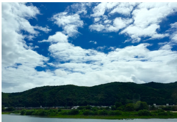
（图 1：摄于前往富士山途中）