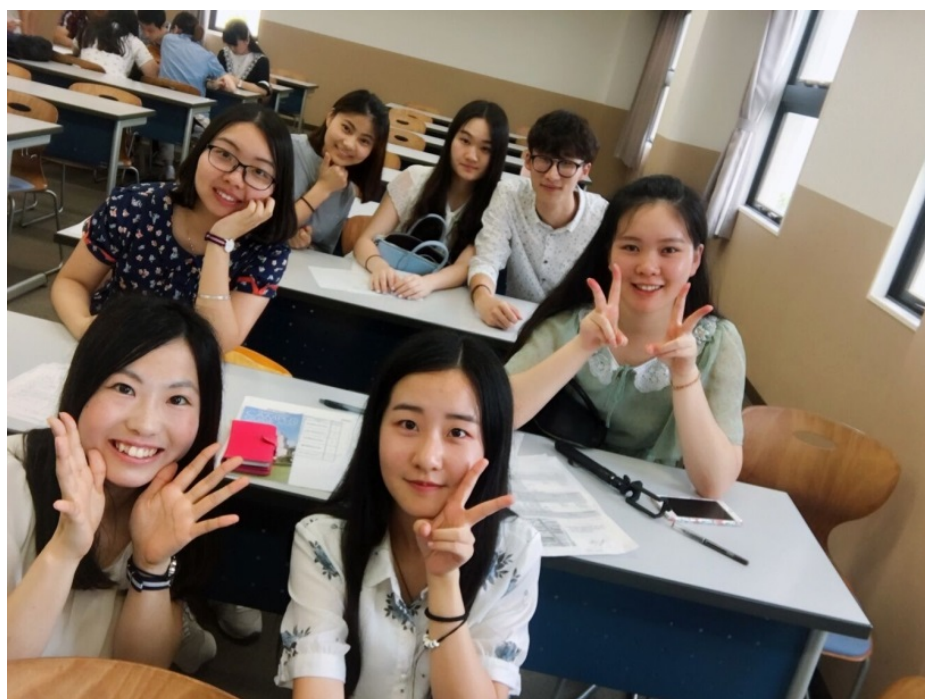
关西大学学生交流

在师资办学力量上较为优渥，在校园的布局以及设施方面也显得较为突出。西式的基督教堂、音乐餐厅式的学生餐厅、一望无际的草坪以及宫殿般的音乐教室，关西大学的每个建筑物以及陈设都带给你不一样的记忆。在上午我们认真的听了关西大学教授给我们讲解了关于日本传统的美食文化，让我们在今后几天在日本品味美食的过程得到更深刻的感悟。在日本饮食文化介绍的过程中，亲身示范近距离的感受目鱼丝的制作过程。在关西大学，我们与日本关西学院的学生进行交流，感受不同语言不同国度的学生进行交流，日本小伙伴的热情让我们对这所学校的印象也加深了一层。