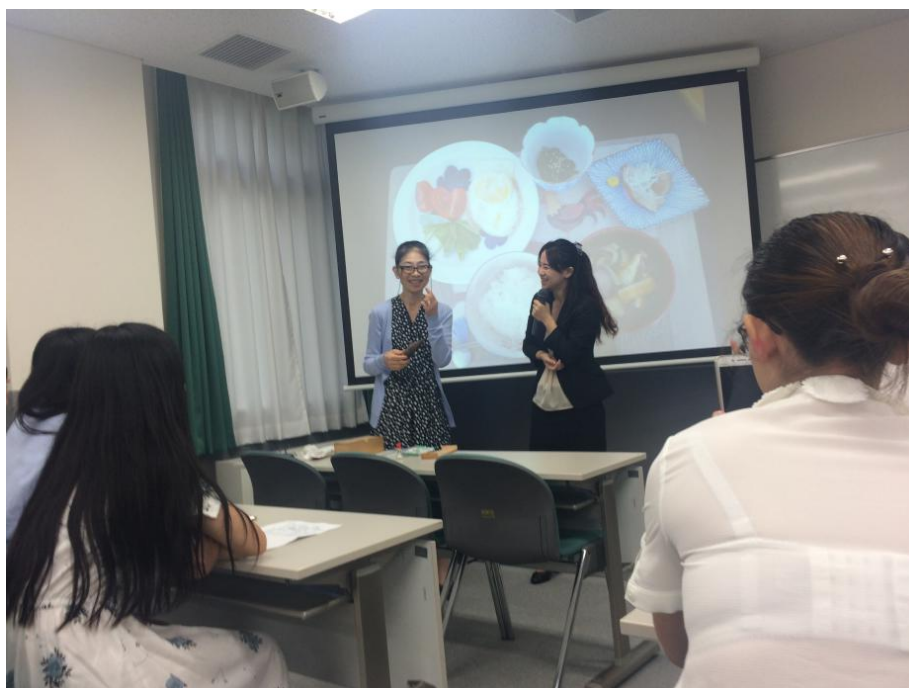
关西学院的饮食文化课程

来到了此地。进入到名古屋图书馆，那一系列陈放的书，干净、整齐，有幸见识到几千年历史的手抄本，尤为珍贵，连进门都是要脱鞋的。更感叹的是自动化的结束设备，进入到书库，都是系统机械化的借书拿书。看到那一个一个机器手臂左转右换，果然还是挺高级的。