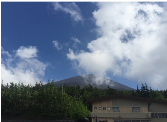
（图 2：摄于富士山半山腰）