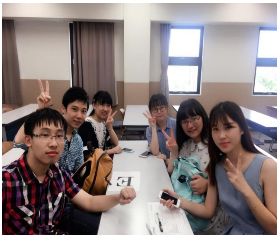
与日本大学生交流

接下来我们离开豊田市前往了中京大学，在中京大学我们正好遇上他们的学园祭，有许多高中生来学校参观，各个专业的学生都将他们自己发明创造的小物件拿出来展览，尤其是工学部的展览，他们给大家展示了自己制作的机器人，设计精巧，做工细致，不仅显示出了他们良好的专业技术，还展现了他们过人的想象力和非凡的创造力。此外，我们还参观了中京大学规模庞大的图书馆。图书馆的藏书都处于地下，取书的方式采用了先进的自动技术，便捷快速，极大地提高了效率。图书馆里还有许多珍贵稀有的古籍，这些完好保存的古籍是中京大学乃至整个国家的十分珍贵的财富。