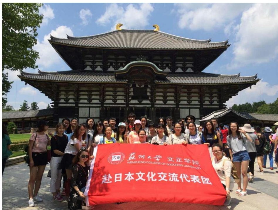
图三：东大寺合影留念

现他们自家车库是正好停下一辆车，增之一分则嫌宽，减之一分则嫌窄。外面的停车场大多采用立体停车场、停车库，空间之利用可谓登峰造极，同时也感叹车技之好。还有就是地下铁网络十分发达，四通发达。这里的车辆极为遵守交通规则，一片秩序井然的样子。真正做到了“车