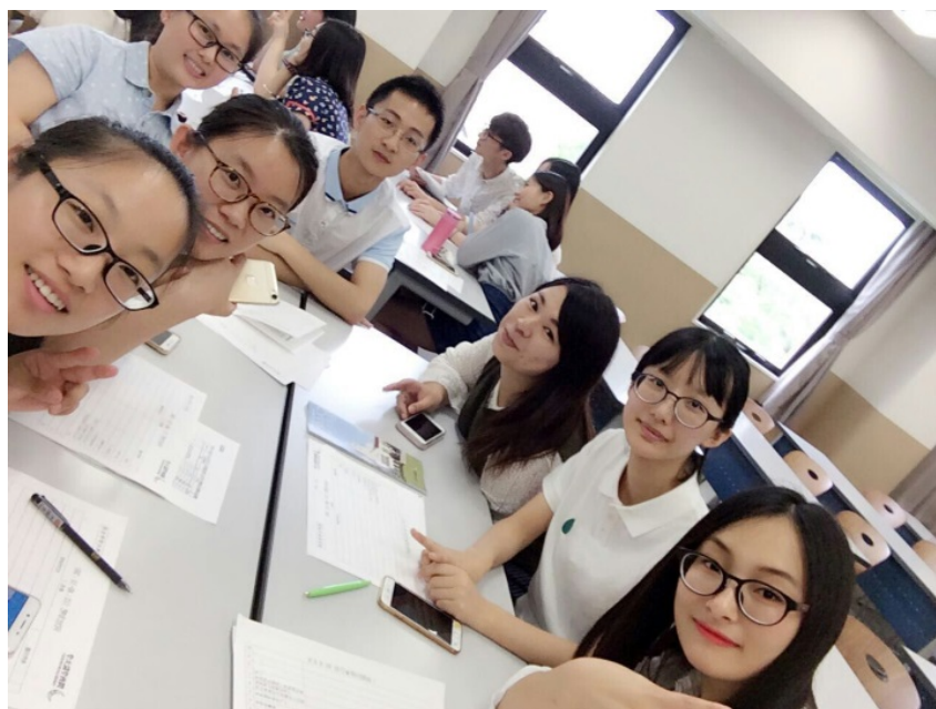
图四：与关西大学学生交流

求，配置了专门设施。细节之中处处显露着人性的关怀。与我们交流学习的学生大多是中文系的，可以用中文和我们交流。他们都很热情，我们相谈甚欢，欢声笑语不断。