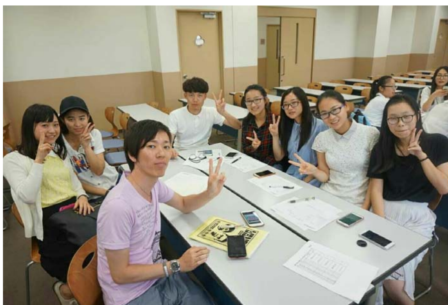
关西学院大学交流

如果说上午我能从饮食文化中发现中国文化的影子，那么下午的课——现代日本和地域文化，几乎让我看到了半个唐朝的缩影。这节课主要介绍了五个寺庙，分别是：東大寺、唐招提寺、金閣寺、嵐山、清水寺。唐朝高僧鉴真七度日本，讲授佛学理论，传播博大精深的中国文化，促进了日本佛学、医学、建筑和雕塑水平的提高，唐招提寺就是鉴真精心设计的。这些建筑和文化，从风格到理念、从布局到构造都弥漫着一股浓浓的“唐朝味”。这不由让我想到一句话：“学人之长，补己之短；学敌之长，克敌制胜。”前一句大家都知道，后一句，知道的人便不是很多了。当我脑子里闪现出这句话的时候，我很清晰的知道，我在恐惧，在担忧，而这种恐惧和担忧来自于中国传统文化的流失。这节课我还注意到了一个小细节，就是日本课堂的资料和教案都是双面打印，这说明日本人很重视资源的利用。